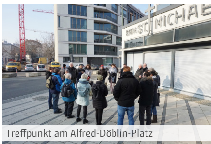
Treffpunkt am Alfred-Döblin-Platz