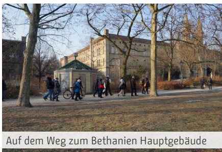
Auf dem Weg zum Bethanien Hauptgebäude