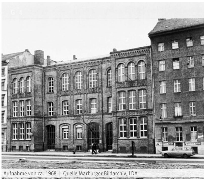
Aufnahme von ca. 1968