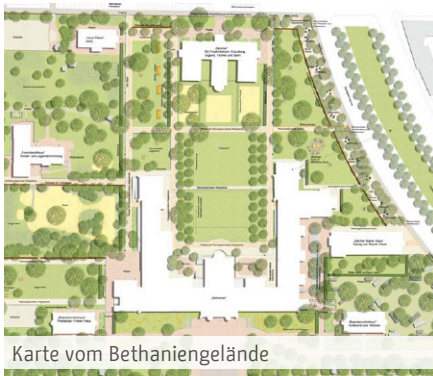
Karte vom Bethaniengelände