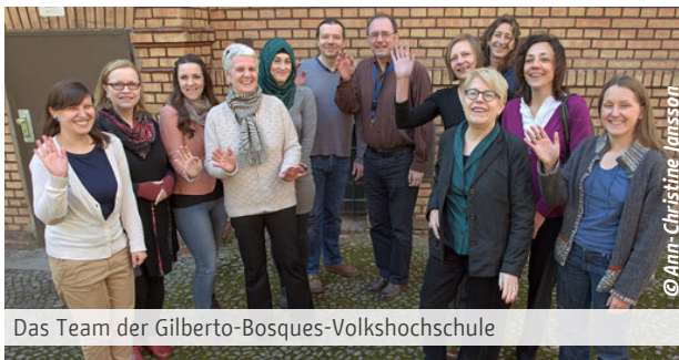
Das Team der Gilberto-Bosques-Volkshochschule