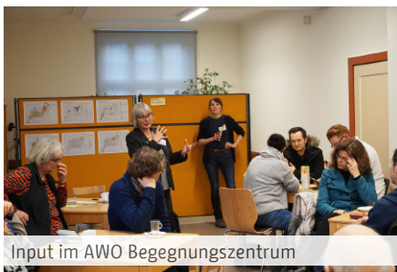
Input im AWO Begegnungszentrum