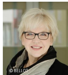
Agentur BELLOT Christine Bellot