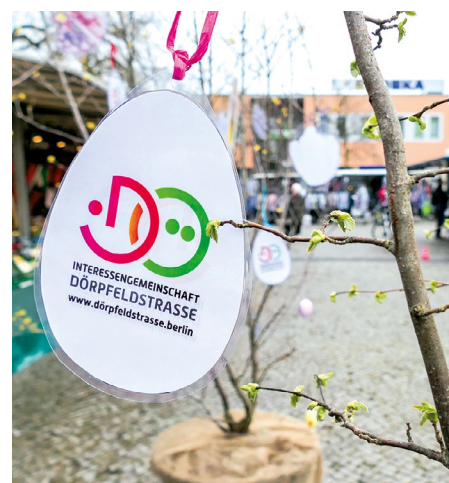
Die Osterbaumaktion wird durch den Kiezfonds ermöglicht