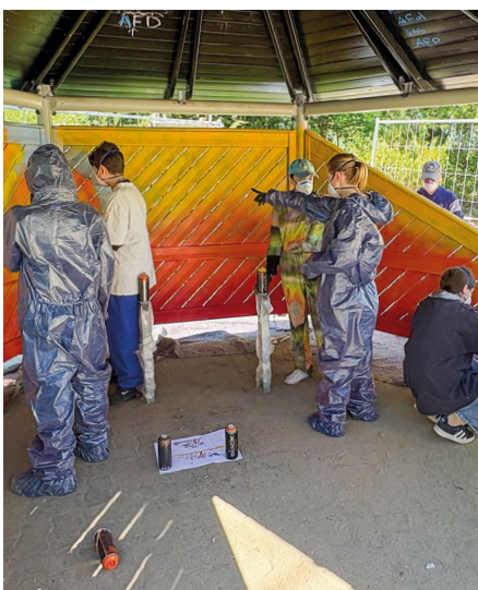
Farbenfrohes Graffiti von Schülerinnen und Schülern der Anna-Seghers-Schule

Ein leises Zischen, klackende Farbdosen und viel Gelächter: Auf dem Spielplatz an der Schneckenburger Straße wird es bunt. Zwischen Spielgeräten und dem