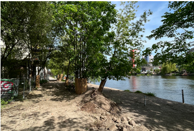
Spreeuferweg im Bau