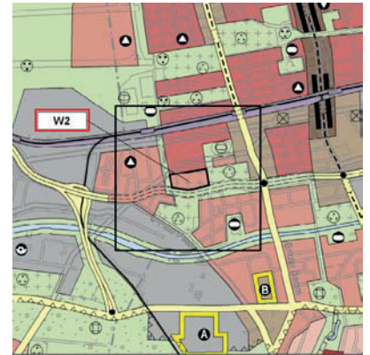
Beabsichtigte FNP-Änderung 1:25.000